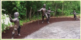
SCULPTURE DÉPORTATION DEPORTATION SCULPTURE