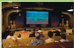
THÉÂTRE MULTIMÉDIA MULTIMEDIA THEATRE