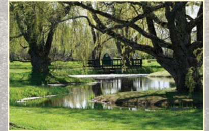
ÉTANG AUX CANARDS DUCK POND