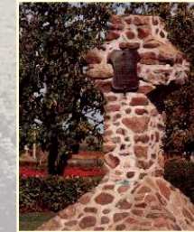
CROIX DE HERBIN HERBIN CROSS