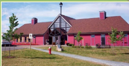
CENTRE D'ACCUEIL/VISITOR CENTRE