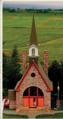
ÉGLISE-SOUVENIR MEMORIAL CHURCH