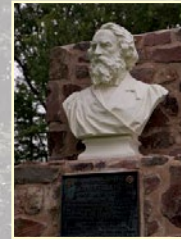
BUSTE DE LONGFELLOW BUST OF LONGFELLOW