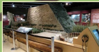
SALLE D'EXPOSITION/EXHIBIT HALL