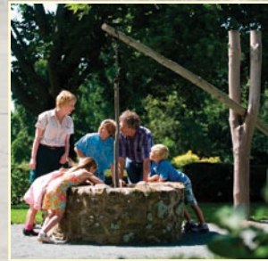
VIEUX Puits/OLD WELL