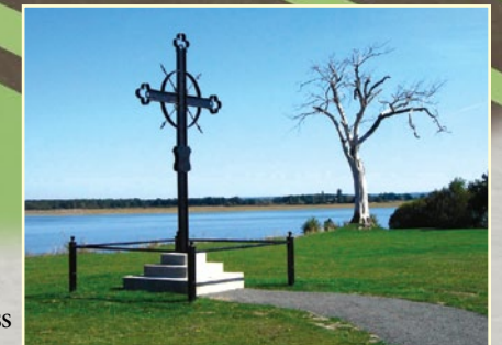
CROIX DE LA DÉPORTATION/ DEPORTATION CROSS Horton Landing