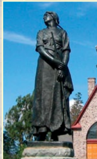
STATUE D'ÉVANGÉLINE STATUE OF EVANGÉLINE